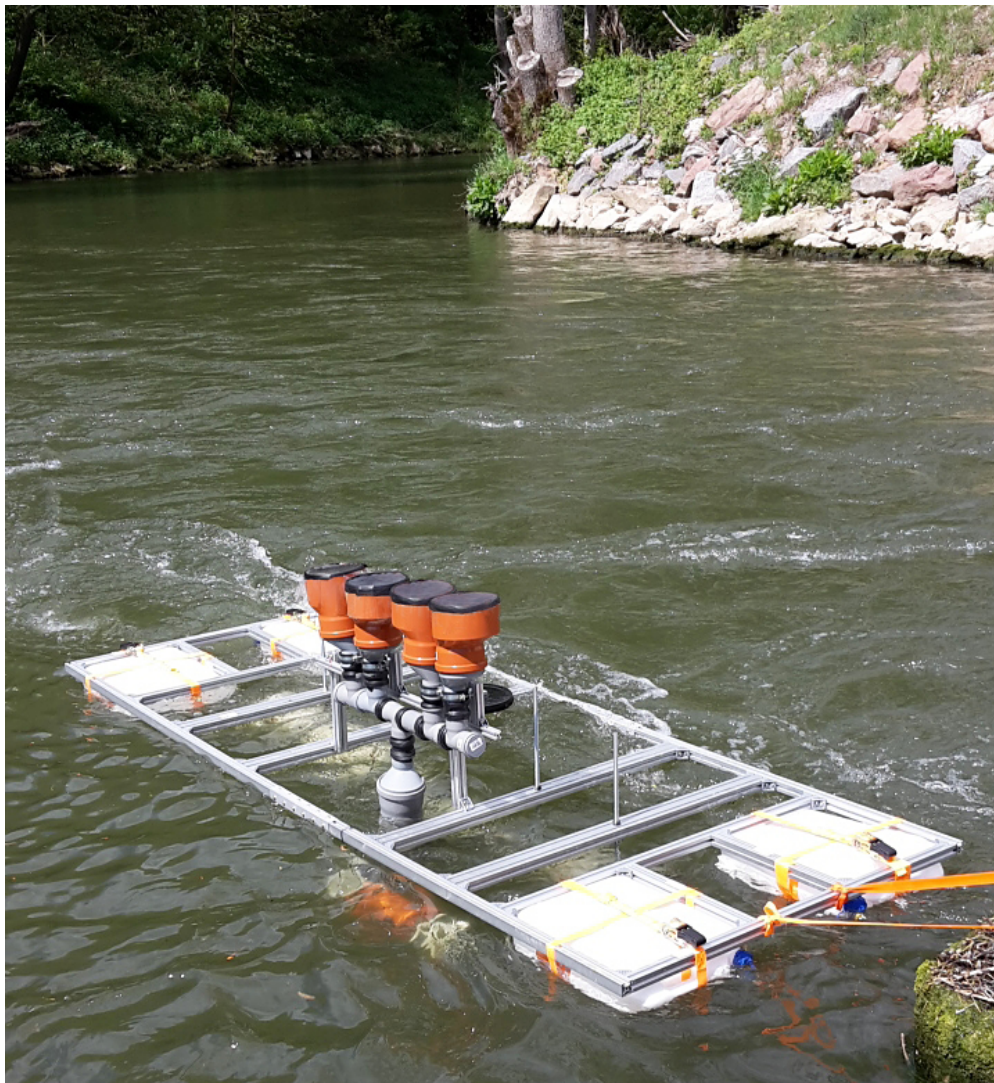
Feldversuch mit DEGREEN-Generatoren in einem Fließgewässer. Die Anregung der Silikonmembranen erfolgt über den Unterdruck in den wasserdurchströmten Venturi-Rohren unter dem Floß.

© Fraunhofer ISC | Bild in Farbe und Druckqualität: www.fraunhofer.de/presse .